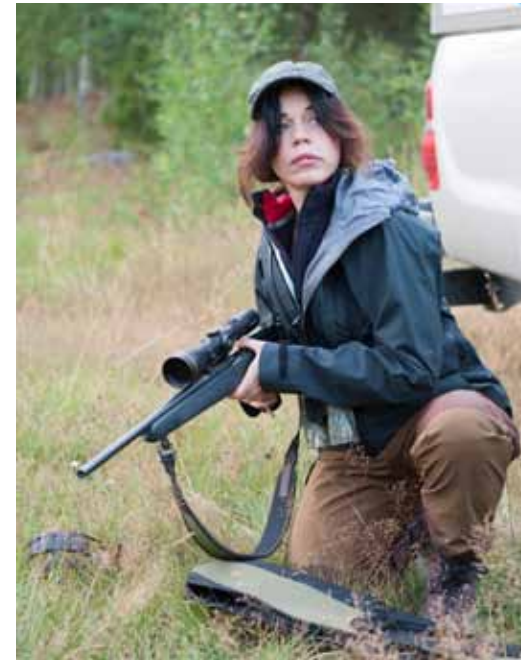
Lotta hinner knappt ladda innan det börjar röra sig i fältet.

Väl därute börjar plötsligt en stor yta vaja samtidigt som vi hör små kulingar grymta och snacka runt oss. Flera gånger har vi dem på bara någon meters håll, men de vägrar gå ut på den öppna skadeytan. ►