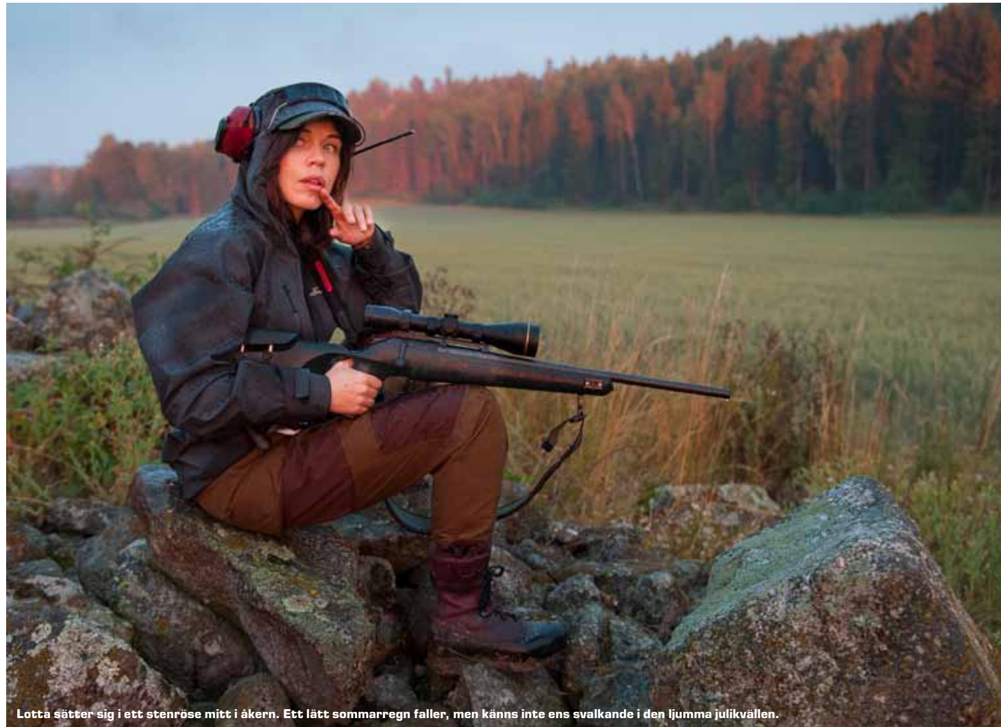
Lotta sätter sig i ett stenröse mitt i åkern. Ett lätt sommarregn faller, men känns inte ens svalkande i den ljumma julikvällen.