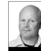
TEXT & FOTO: MIKAEL GRENNARD

Här skulle det kanske passa med en käck liten bildtext. antar jag.