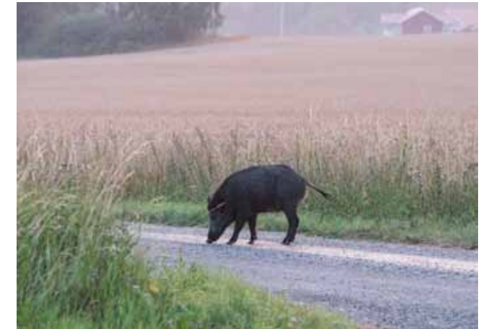
Mitt på vägen står helt plötsligt ett vildsvin när vi flyttar mellan två åkrar.