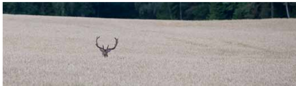
Det är inte bara vildsvinen som gottar sig i vetet.

Vårt sökande efter den bästa matsäcken får alltså fortsätta. Men i utbyte mot denna tyvärr resultatlösa jaktkväll fick vi förutom spännande upplevelser med oss ett ruggigt gott recept på vildsvin. ■